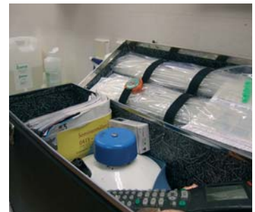
Progesteronanalyser hjälper dig att kontrollera att du ligger rätt med dina semineringar.