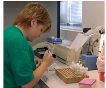
Dina mjölkprover kan analyseras på Steins laboratorium i Jönköping.

Progesteronnivån varierar beroende på var kon befinner sig i sin sexualcykel. Låg progesteronnivå indikerar brunst.